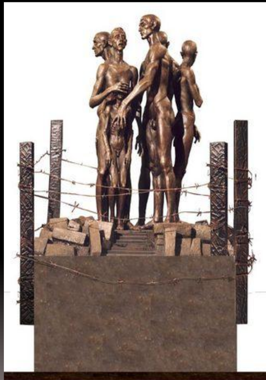
«ЖЕРТВАМ РЕПРЕССИЙ» - ПАМЯТНИК ЖЕРТВАМ ХОЛОКОСТА В СЕССЕ (УКРАИНА). БРОНЗА. ВЫСОТА 1,2 М. "TO VICTIMS OF PURGES" - MONUMENT TO VICTIMS OF THE HOLOCAUST IN COESZA (UKRAINE). BRONZE, 1.2M HIGH.