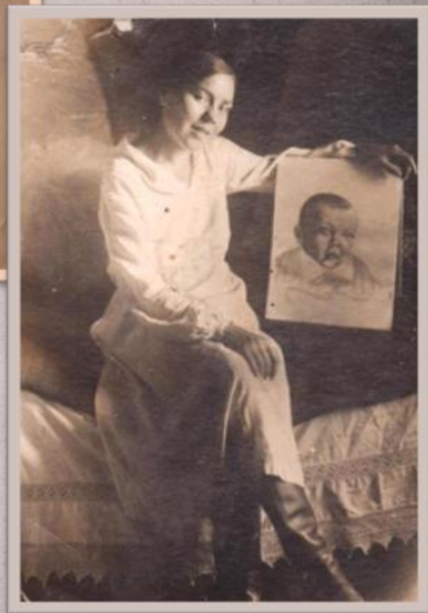
1933г. На портрете, написанном мужем, сын-первенец.