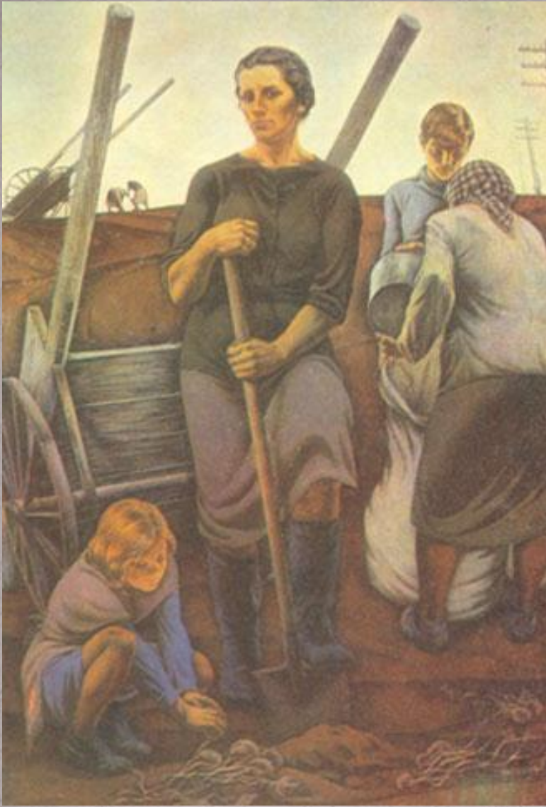
«Тыл. 1941 год» Автор: Ракша Ю.

Муж переживал неслучайно. Сания действительно долгие годы оставалась для окружающих «чужой», «казанской», «городской», её сторонились. И впоследствии, когда муж пропал без вести, она практически одна, без чьей-либо помощи, поднимала детей на ноги. Никаких пособий от государства не получала. В крохотном домике, где они жили, было много-много книг, стояли стол, стулья и деревянная кровать. И когда, спустя годы, младший сын женился и привёл молодую жену в дом, в нём не нашлось места, чтобы поставить даже раскладушку.